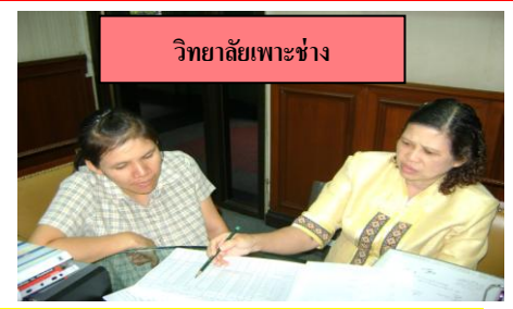
วิทยาลัยเพาะช่าง