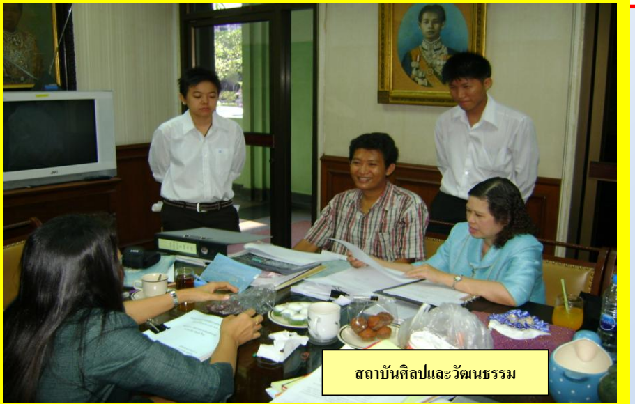
สถาบันศิลป์และวัฒนธรรม