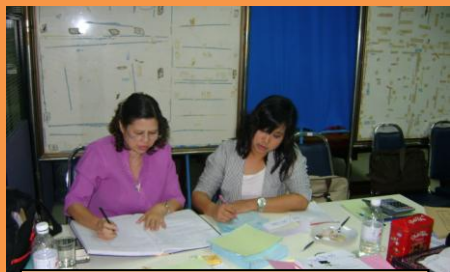
สำนักบริหารพิพิธภัณฑ์ จักรวรรดิ